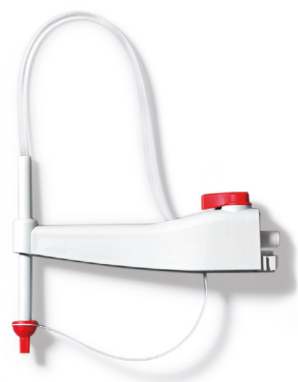
Cánula de valoración con caperuza a rosca y con válvula de salida integrada y válvula de purga

Con los accesorios originales de Titrette® creará las condiciones de trabajo ideales en el laboratorio.