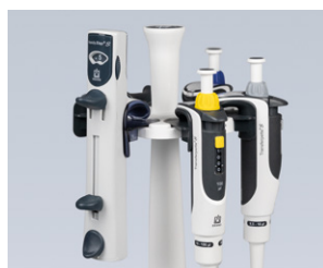
El soporte para estantería se adapta también para el soporte de mesa de la Transferpette® S.