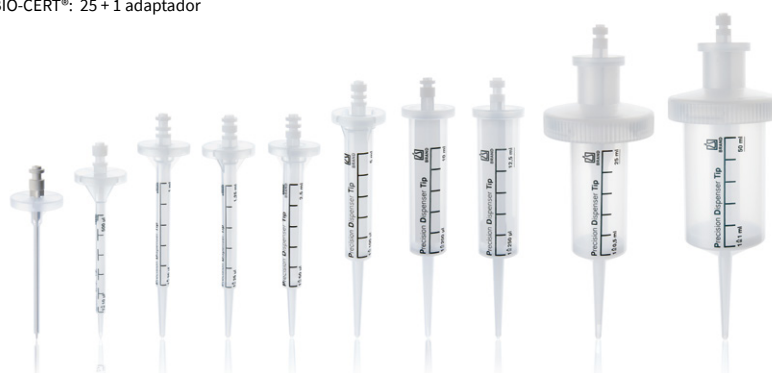
Tabla de precisión

* unidades por embalaje BIO-CERT®: 25 + 1 adaptador