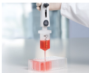
Sistema dispensador repetitivo