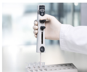
Dispensación de pequeños volúmenes