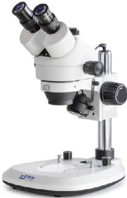
OZL 464 Con caballete estándar