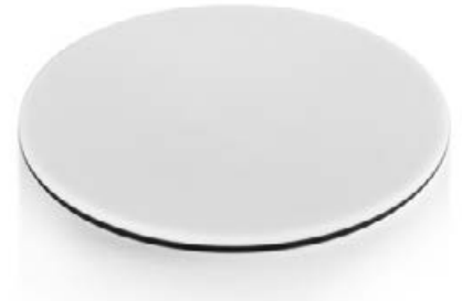
Pieza insertada para caballete blanca