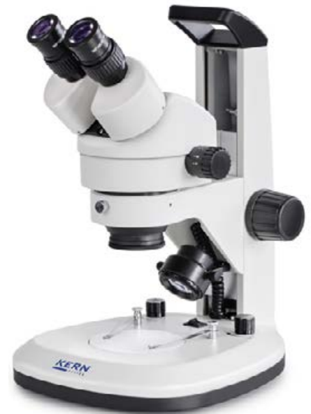
OZL 467 Con asa