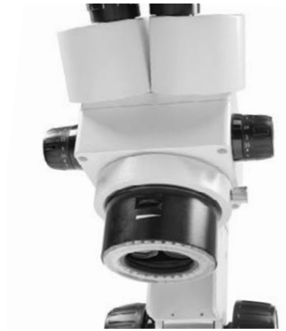
Iluminación de anillos LED integrada, regulable sin escalonamiento