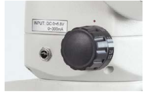
Conexión de corriente