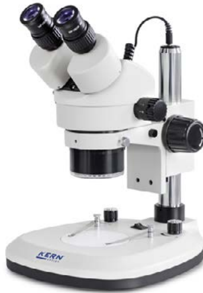
OZL 465 Con anillo de iluminación