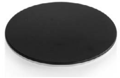
Pieza insertada para caballete negra